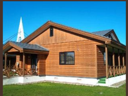
D棟 ツツジ E棟 ハマナス

備品 / テレビ・冷蔵庫・電子レンジ・オーブントースター・電気ポット・炊飯器 ・調理器具(包丁・鍋等)・食器・寝具・洗浄便座付きトイレ 他