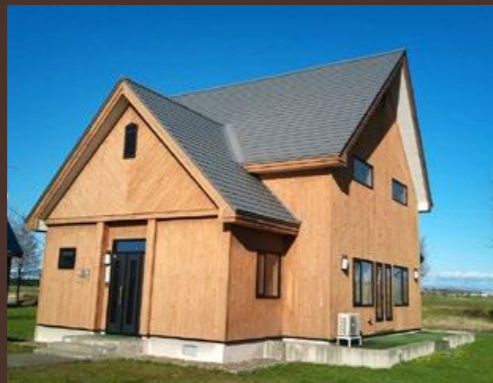
B棟 プラタナス C棟 コスモス